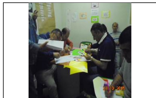
IMG. N° 001 Reinserción Social: Subprograma para la Atención de Internos en el Área Social, EP. Santiago 1.

Comentario: La semana comprendida entre el 26 y 30 de octubre se da inicio a 15 talleres psicosociales programado para imputados de los diferentes módulos de reclusión.